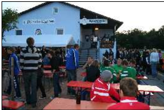
60 Jahre 1. FC Schmidgaden Juli 2009