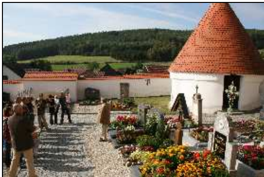
Tag des offenen Denkmals in Rottendorf, September 2009