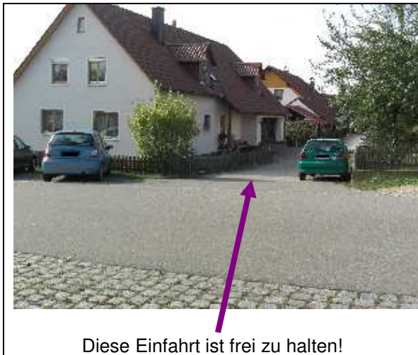
Diese Einfahrt ist frei zu halten!

Für die Anwohner der Kindergartenstraße ist es kein Spaß mehr. Schon seit Jahren klagen die Bewohner in unmittelbarer Nähe des Kindergartens über die Parkproblematik vieler Mütter und Väter, die ihre Kinder zum Kindergarten bringen oder von dort wieder abholen. Es werden Einfahrten oder Straßenteile zugeparkt, dass kein Durchkommen mehr ist. An die Vernunft zu appellieren, ist manchmal erfolglos. Man meint, eh nicht lange stehen zu bleiben und ist gleich wieder weg.