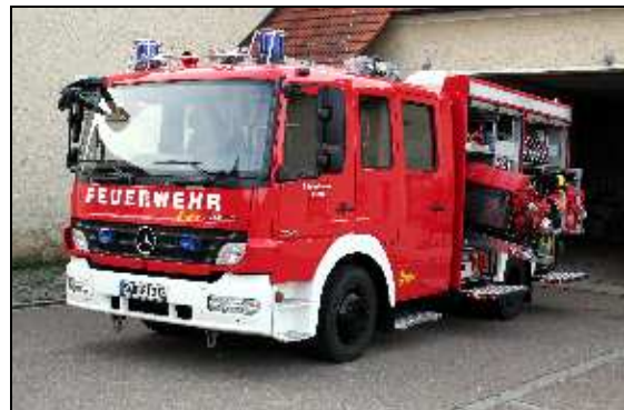
Das neue Feuerwehrauto der FF Trisching abgeholt am 28.10.2009