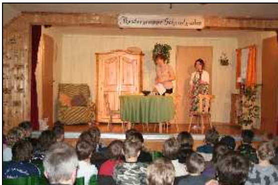
20 Jahre Theatergruppe Schmidgaden März 2009