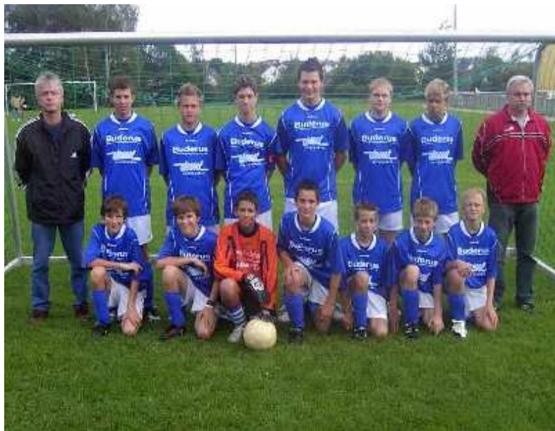
Die C-Junioren mit Ihren Betreuern

Die D- Junioren belegten in der Qualifikationsrunde den 5. Platz, während die A- Junioren zu Zeit leider den letzten Tabellenplatz innehaben.