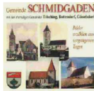
Bildband, Preis: 16,80 €