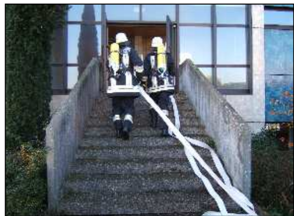
Sicherheitstag an der Hauptschule Schmidgaden in Zusammenarbeit mit der Freiwilligen Feuerwehr

An dieser Stelle wird auch Herrn Richard Altmann gedankt, der regelmäßig zahlreiches Bildmaterial zur Verfügung stellt.