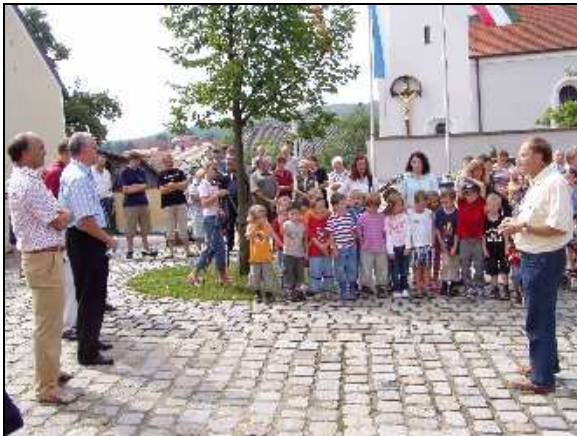
Bewertungskommission „Unser Dorf soll schöner werden“ in Trisching Juli 2005