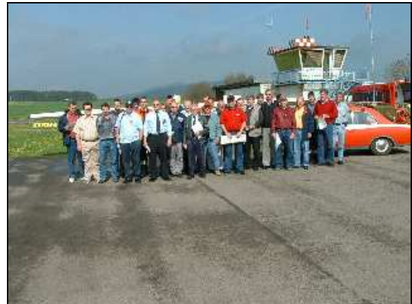
Fortbildung der Flugbeobachter der Oberpfalz am Flugplatz Schmidgaden, Mai 2005