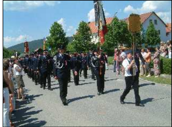
125 Jahre FF Trisching 28. bis 30. Mai 2005