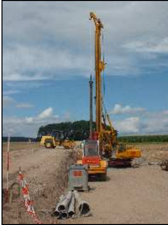
Beginn der Bauarbeiten an der A 6, hier beim sog. „Hennahölzl“ – August 2005