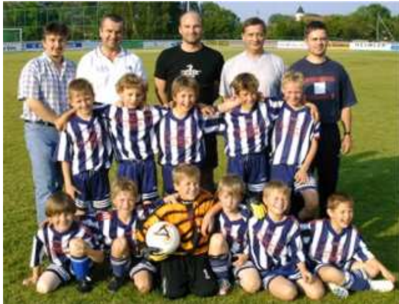
Die E-Junioren mit Ihren Betreuern

Im Jugendbereich gibt es wieder zwei Aushängeschilder. Während die E- Junioren in der Qualifikationsrunde klar den Meistertitel errungen haben, wurden die C- Junioren erfolgreicher Herbstmeister in Ihrer Gruppe.