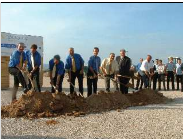
Firmenerweiterung: Spatenstich zum Hallenbau der Fa. Quadrus, September 2005