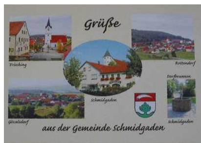
Postkarte, Preis: 0,50 €

Sowohl der Bildband als auch die Postkarte der Gemeinde Schmidgaden sind noch in ausreichender Anzahl vorhanden. Interessenten wenden sich bitte an die Gemeindeverwaltung.