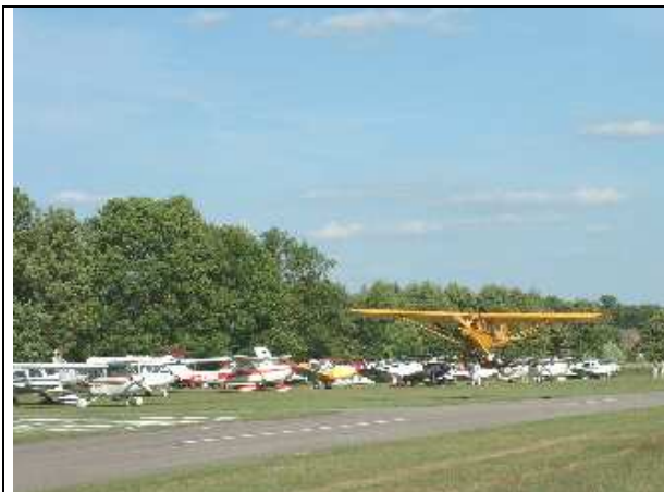
20. Pipertreffen Flugplatz Schmidgaden Juni 2003