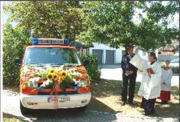
Segnung FFW-Auto Schmidgaden August 2003