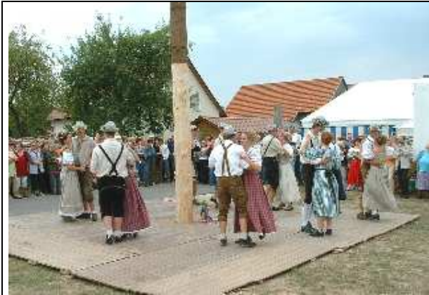
Kirwatanz bei der Trischinger Kirwa September 2003