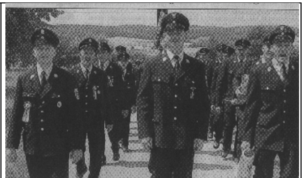
125 Jahre FFW Gösselsdorf Juni 2003

Hier werden zwar nur sechs Fotos gezeigt, aber alle Höhepunkte konnten wir aus Platzgründen nicht veröffentlichen. Doch diese Fotos beweisen, wie facettenreich unsere Bürger- und Vereinsaktivitäten in der Gemeinde sind.