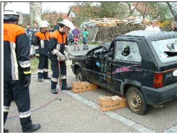
Jugendtag FFW Trisching April 2003